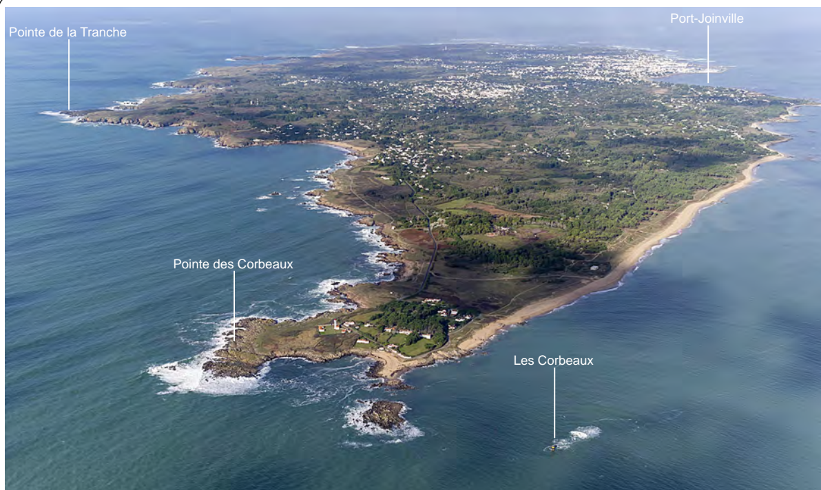
2.1.2. — Atterrissage. L'île d'Yeu (2014).