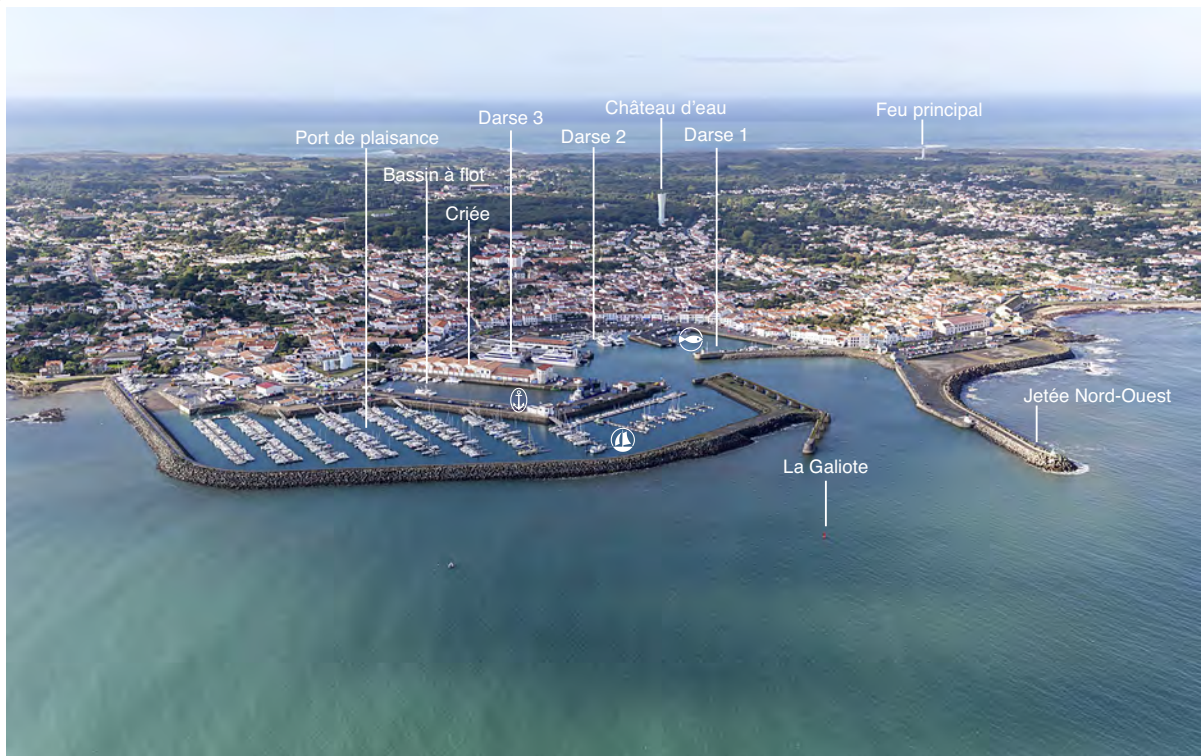
2.2.2. — Île d'Yeu. Port-Joinville (2014).