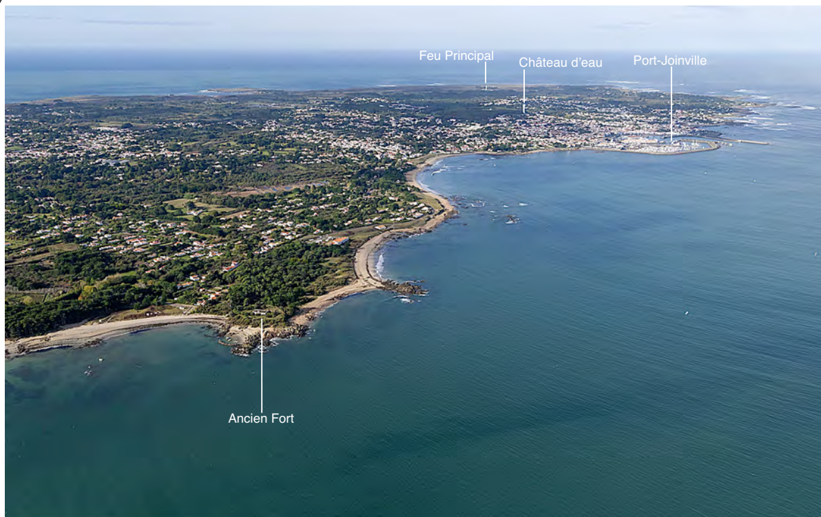
2.2.1. — Île d'Yeu. Côte NE (2014).