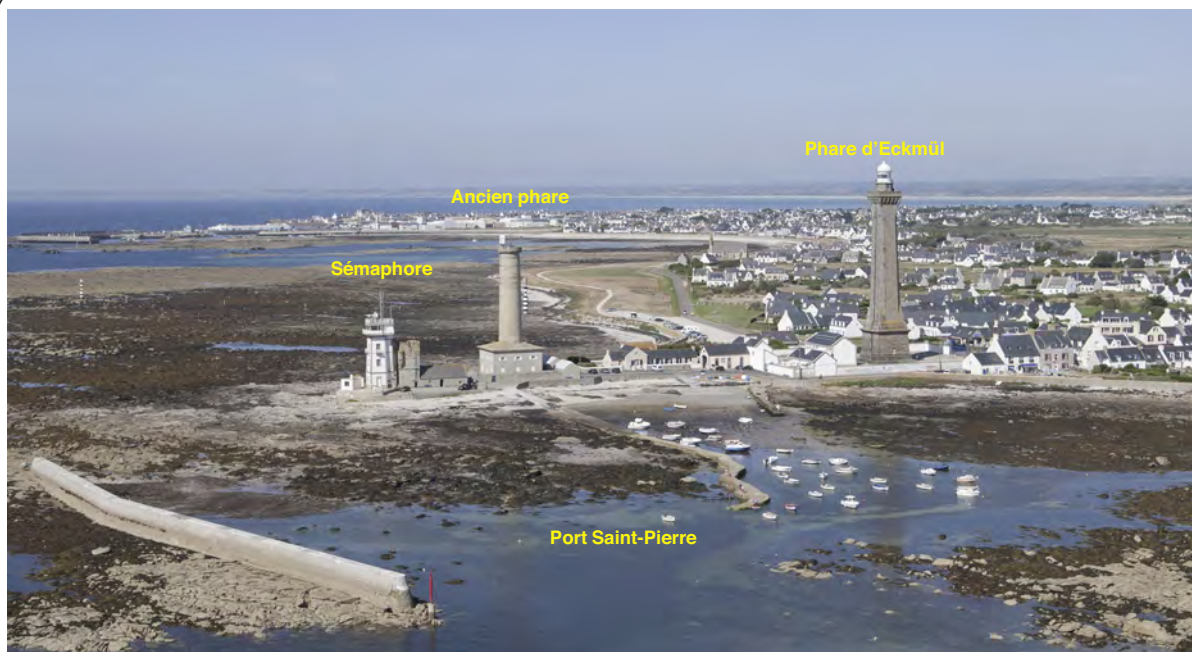
2.2.1. — Pointe de Penmarc'h, à l'WNW (2016).