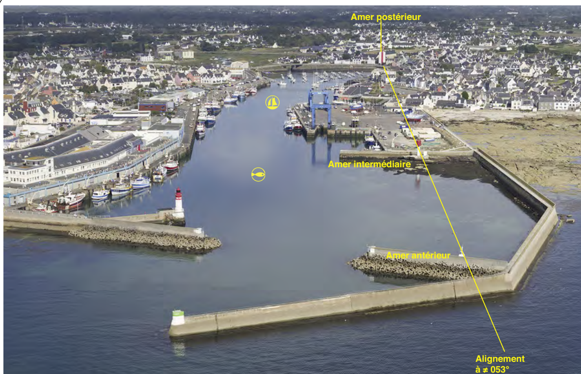
2.2.3. — Port de Guilvinec-Léchiagat. Alignement à 053° (2016).