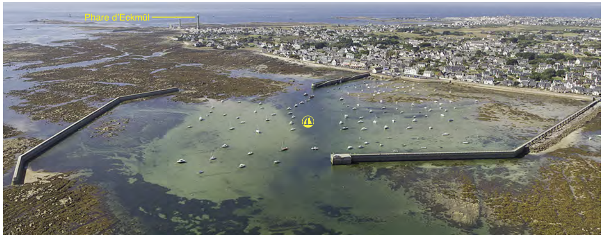
2.2.2. — Kéridy, à l'WNW (2016).