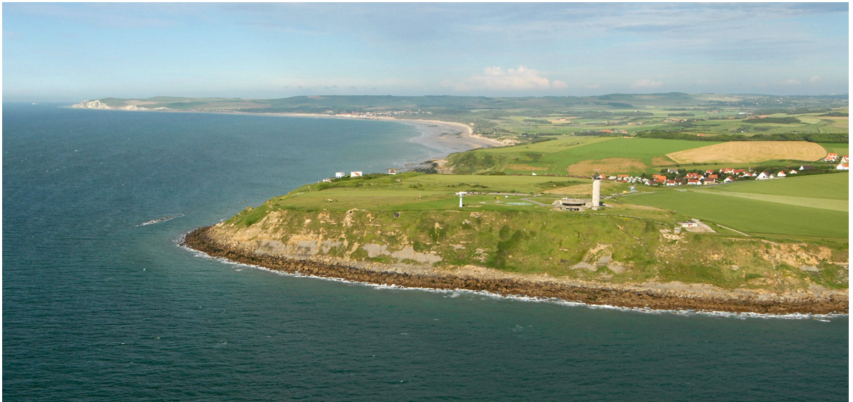
2.2.2.1.C. — Cap Gris-Nez, à l'ENE. Au fond le cap Blanc-Nez (2007).