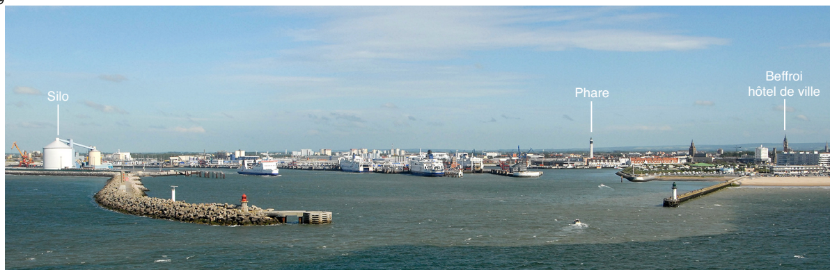
2.2.2.1.A. — Calais, silo, phare et beffroi de l'hôtel de ville, au SE (2007).