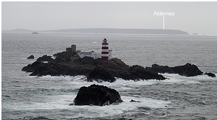
2.2.2.2. — Phare des Casquets, à l'ESE (2007).