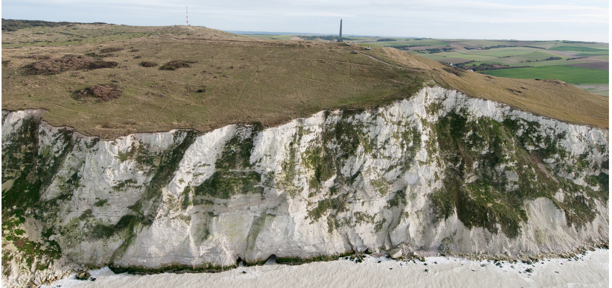
2.2.2.1.B. — Cap Blanc-Nez, au SE (2013).