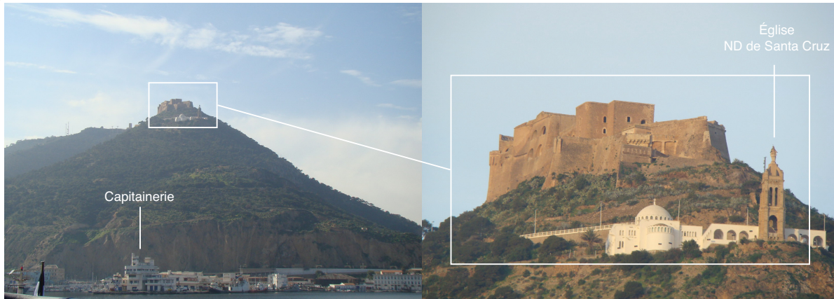
4.3.3.5. — Fort de Santa Cruz (Oran) [2008] ( frégate Lafayette ).

37 La jetée Nord s'étend sur environ 1 M vers le SE. Elle porte un feu près de son extrémité, et un autre feu sur un épi à 0,2 M à l'Ouest de celle-ci. La jetée Est s'allonge sur 0,8 M au NW de son enracinement. Son musoir est marqué par un feu. La passe, ouverte à l'Est, est large d'environ 210 m et profonde de 27 à 30 m.