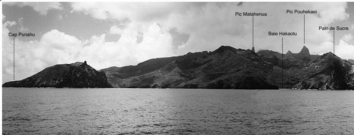
1.1.4.4. — Ua-Pou. Baie de Vaiehu et Baie Hakaotu, à l'Est.

07 On peut mouiller par profondeur de 20 m, fond de sable et de vase, au point indiqué sur la carte. Pour la présentation au mouillage, en venant du SW, on peut utiliser la croix blanche bien visible sur une colline qui domine le côté NE de la baie, à 0,8 M à l'Est du Cap Punahu. La pointe située en 9^{\circ} 23,08' S — 140^{\circ} 07,66' W au fond de la baie est très nette au radar.