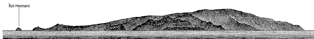
1.1.3.1. — Ua-Huka (côte Sud). L'îlot Hemeni à 287° et 14 M (D'après carte britannique 1640).