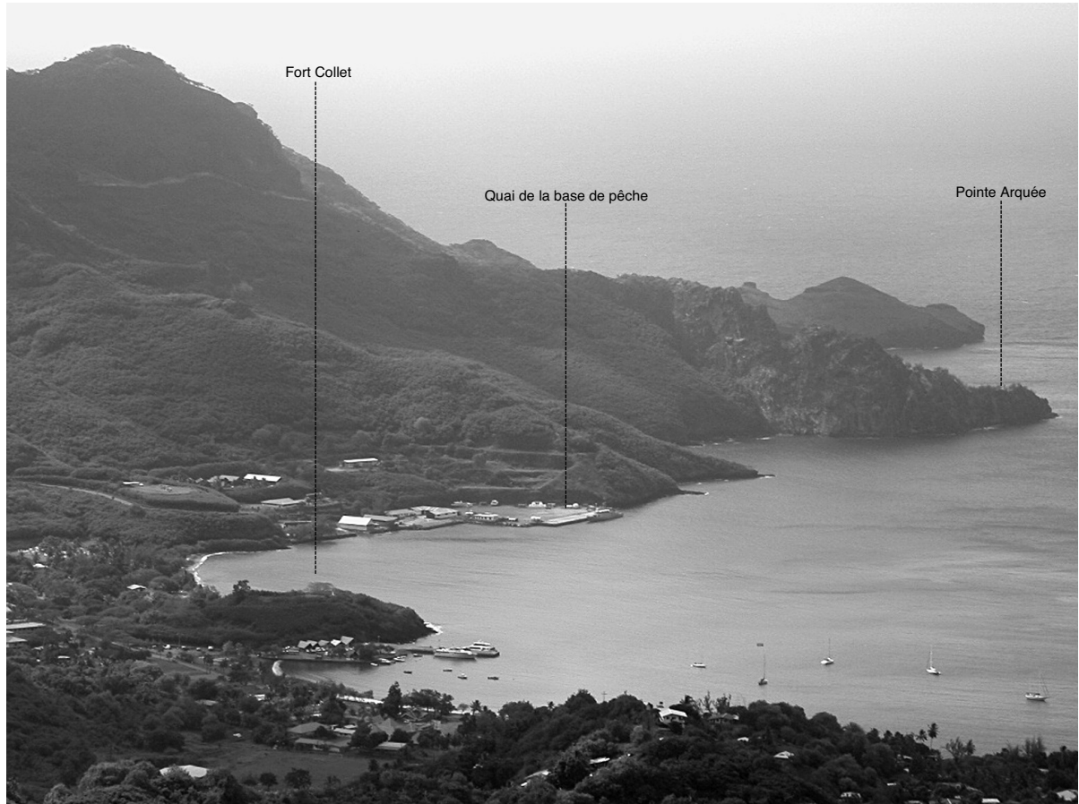
1.1.1.2.A. — Nuku-Hiva. Baie de Taihoae (2005).