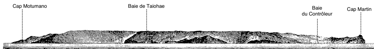
1.1.1.6. — Nuku-Hiva, côte Sud. Le Cap Martin à 017° et 8 M (D'après carte britannique 1640).