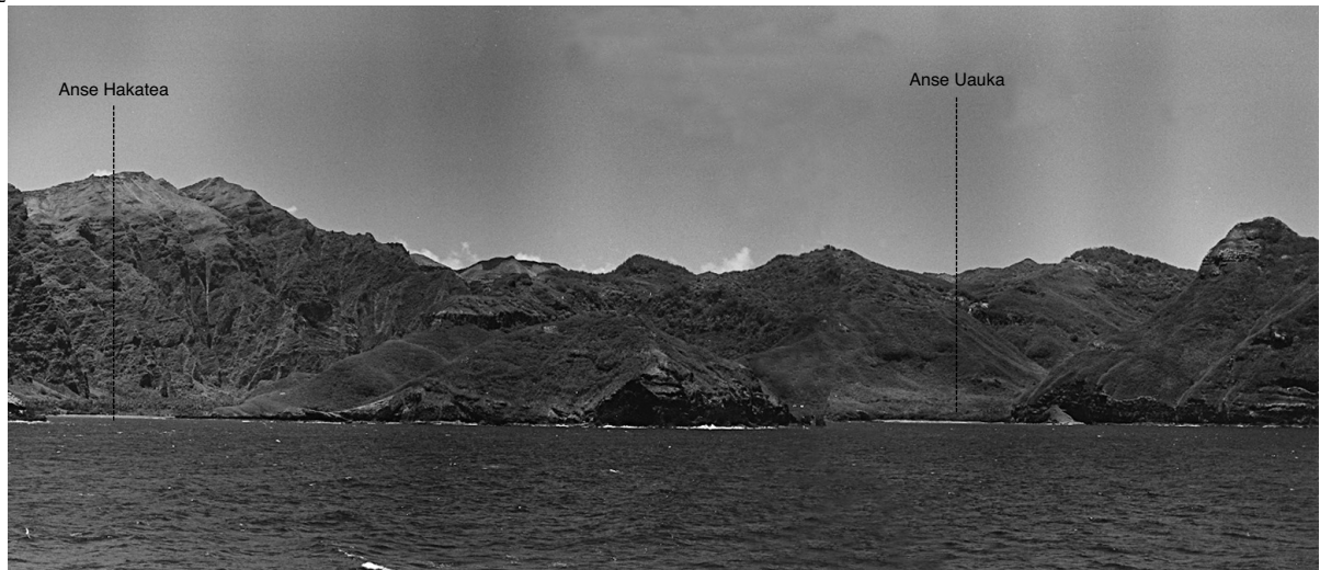
1.1.1.3. — Nuku-Hiva. Baie de Taioa, au NNW.