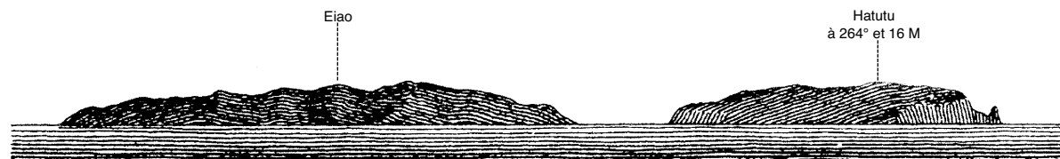
1.1.2.4. — Eiao, Hatutu à l'Ouest (D'après carte britannique 1640).