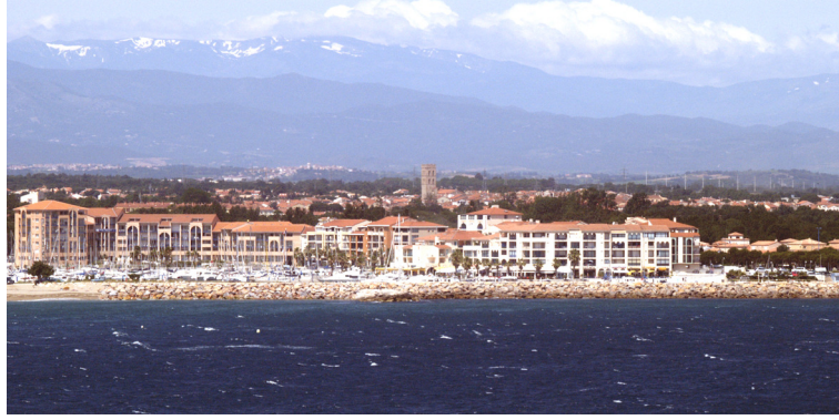
2.1.2.2.C. — Clocher de l'église d'Argelès-sur-Mer, à l'WSW.