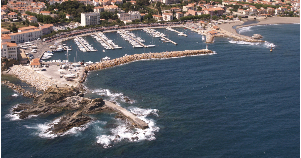
2.1.4. — Port de Banyuls-sur-Mer, au SW (2005).

37 Le port est géré par la mairie de Banyuls-sur-Mer.