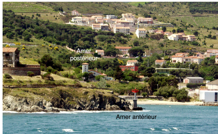
2.1.5.2. — Port-Vendres. Amers de l'alignement à 198,5°.

49 L'avant-port est bordé au Nord par les appontements de la criée, dans l' Anse Gerbal , entre la Pointe du Fanal et la Pointe des Pilotes .