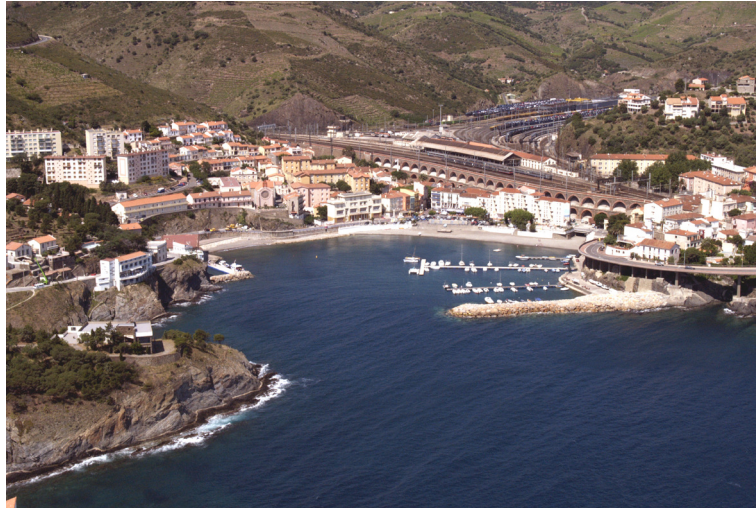
2.1.3. — Port de Cerbère, à l'Ouest (2005).